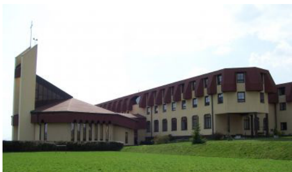
Obrázok 2 – Budova Kňazského seminára sv. Františka Xaverského v Badíne