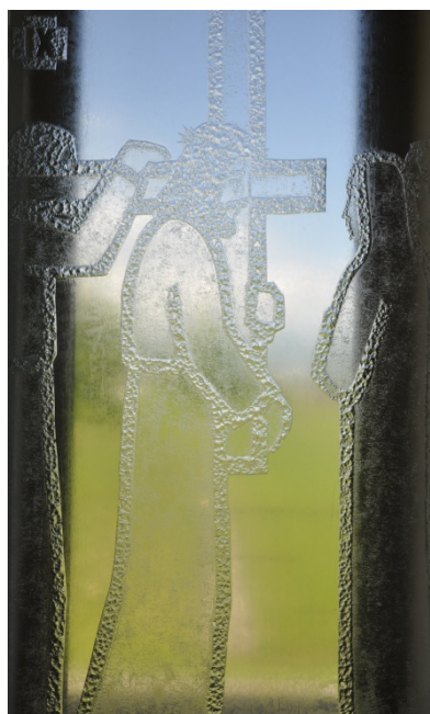
Obrázok 1 – Jedno zo zastavení krížovej cesty v kaplnke KSFX