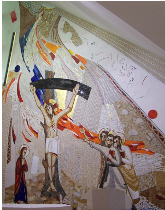
Obrázok 3 – Mozaika v kaplnke Kňazského seminára sv. Františka Xaverského v Badíne