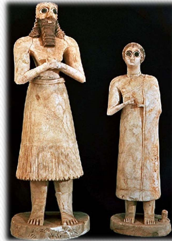
Figurínky z Tell Ašmar, Abu Chrám