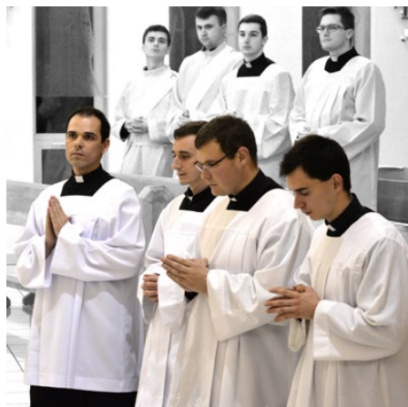
Lektorát (3. ročník)

Počas posledného týždňa sa prípravy zintenzívnia. Vo vstupnej hale seminára stavíme stromček a v predvečer odchodu domov slávime náš tradičný Štedrý večer. Začíname svätou omšou, po ktorej spievame Tichú noc a cítime, že Vianoce sú na dosah. Potom nasleduje štedrá večera,