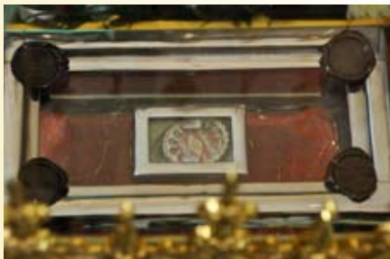
Pohľad na relikviu sv. Cyrila - detail zhora

Počas týchto dvoch mesiacov sa na miestach, kam relikvia zavítala, slúžili v kostoloch sväté omše, inde zase dôstojný priebeh uctenia kňazi farnosti zabezpečili modlitbami, čítaním z evanjelií, príhovorom cirkevných historikov či spoločným spevom veriacich. Všetci veriaci našej diecézy prijali s potešením možnosť vzdať úctu ostatkom tohto vzácneho človeka, veľkého filozofa a predovšetkým svätca, tak nesmierne významného pre náš národ.