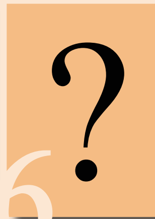
Kto bude ďalší?

Pochádza z Partizánskeho, farnosť Šimonovany, kde prežil aj svojich 24 rokov. Navštevoval SPŠ v Partizánskom. Má šesť súrodencov. Rád športuje a číta. Miništrovať začal ako 12-ročný, no o kňazstve vôbec nepremýšľal. K tomu prišlo až po vojenskej službe, keď sa ako 23-ročný rozhodol odpovedať na Pánove volanie. Ako doping mu slúži adorácia pred sviatosťou oltárnou a modlitba.