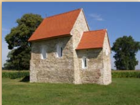
Kostolík sv. Margity Antiochijskej v Kopčanoch je pôvodnou stavbou z obdobia Veľkej Moravy.