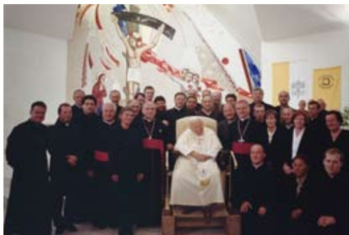
Bl. Ján Pavol II. s vyučujúcimi a predstavenými v seminárnej kaplnke 12. septembra 2003