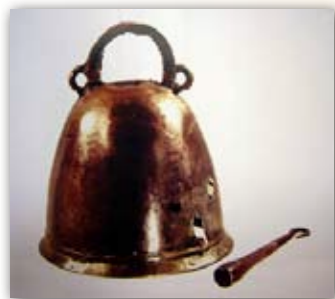
Zvon so srdcom z Bojnej

Popri kostoloch nám počiatky príchodu kresťanstva k našim predkom stále lepšie osvetľujú hmotné nálezy. Na prvom mieste sú to bronzové pozlátené plakety a tiež zvony či ich časti a iné predmety s kresťanskými znakmi z veľmi významného náleziska na stredovekom hradisku pri obci Bojná (okres Topoľčany), kde pre pár rokmi začal a stále pokračuje archeologický výskum. Početné nálezy z Bojnej výrazne posunuli a rozšírili naše vedomosti o počiatkoch christianizácie u nás z doby začiatku 9. storočia ešte pred príchodom sv. Cyrila a Metoda. Unikátny je aj závesný krížik z obce Dojč (okres Senica) z 9. storočia a ďalší kríž pochádzajúci z Horných Orešian (okres Trnava) z 2. polovice 8. storočia, ktoré rozširujú nálezový fond krížov z raného stredoveku na Slovensku. K veľmi zaujímavým patrí aj objav hlaholských písmen na črepe keramiky, nájdený v roku 2009 v sídle Pribinu v Blatnobre, ktoré ležalo pri jazere Balaton v dnešnom Maďarsku. Doteraz sa totiž