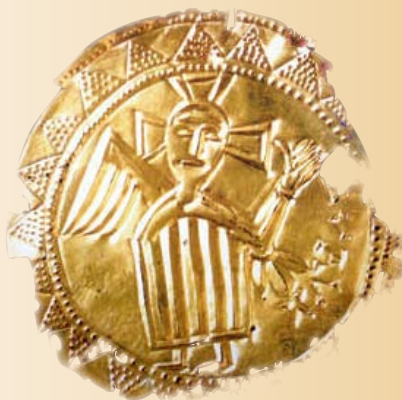
Pozlátená bronzová plaketa nájdená pri obci Bojná

nič podobné pri archeologickom výskume nenašlo a hlaholské písmo bolo známe len z listinných pamiatok. Tiež ide najpravdepodobnejšie o najstarší dochovaný zápis hlaholiky.