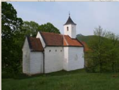
Kostol sv. Juraja v Kostol'anoch pod Tribečom pochádza z doby vzniku Uhorského kráľovstva.

Novším výskumom sa potvrdilo, že počiatky Kostola sv. Michala v Dražovciach, ležiaceho neďaleko Nitry na skalnom ostrohu