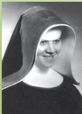
Bl. sestra Zdenka nás učí žiť v nádeji, že aj „za mrakmi je slnko“.

Trochu neskôr, 30. júla, sa nám prihovára naša slovenská svätica – blahoslavená sestra Zdenka Schelingová. Známa je jedna jej myšlienka: „Za mrakmi je moje milované slnko.“ Čas prázdnin je najmä čas tepla, slnka, a to by sme radi zažívali aj počas celého života. Slnko vo vzťahoch, v práci. Avšak niekedy prichádzajú i mraky. Bolesť, utrpenie, nepohoda, nezhoda. Blahoslavená sestra Zdenka nám však upriamuje pozornosť na nádej. Nádej, že za mrakmi je slnko. To je ďalšia výzva pre nás: upevňovať svoju nádej, nádej v Krista.