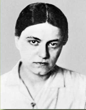
Podľa sv. Terézie Benedikty od Kríža milovať Boha znamená milovať človeka.

Pár dní po sestre Zdenke, teda 9. augusta, nám Cirkev predstavuje osobu svätej Terézie Benedikty od Kríža, známej ako Edita Steinová. Celý život človeka je o láske, o láske k Bohu a láske k človeku. Svätá Edita Steinová raz vypovedala i túto myšlienku: „Naša láska k človeku je meradlom našej lásky k Bohu.“ Mnohokrát sa pýtame, ako vieme, že skutočne, opravdivo milujeme Boha. Svätá Edita Steinová nám dáva odpoveď: milovať človeka. V každom našom bratovi a sestre sa skrýva samotný Boh. Boh, ktorému mám slúžiť týmto spôsobom. Týmto praktickým spôsobom. Keď milujem blížnych, milujem Pána. Hneď sa nám bude ľahšie slúžiť, keď budeme mať vo vedomí tieto Kristove slová: „Čokoľvek ste urobili jednému z týchto maličkých, mne ste urobili.“