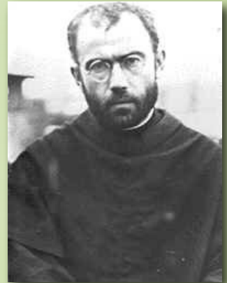
Sv. Maximilián Mária Kolbe založil svoj vzťah k Ježišovi na ceste k nemu cez jeho matku Máriu.

Niekoľko svätcov, niekoľko ciest, ako sa i počas týchto prázdnin upevniť v láske k Bohu i človeku.