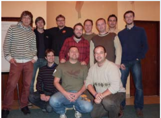
Na stretnutí s aktivistami z iných kresťanských cirkví: „Ekumenizmus je pre mňa stretávanie sa s bratmi.“

Ekumenizmus? Myslím, že je to stretávanie sa s bratmi. Keď som ja bol na takom stretnutí, ktoré robili bratia z iných kresťanských Cirkví, prvýkrát, bol som prekvapený z toho, ako profesionálne to dokážu urobiť. A postupne sme sa spriatelili. Ekumenizmus je pre mňa zápas, zápas o jednotu vo viere v Boha, o spo-