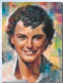
Sv. DOMINIK SAVIO

Hovorí sa o ňom ako o chlapcovi, ktorý „vedel chcieť“. Mal pevnú vôľu a dokázal ňou vzdorovať zlu.