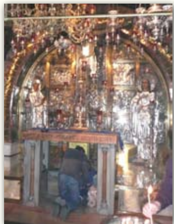
Vrch Golgota, ktorý sa nachádza v Bazilike Božieho hrobu.

V rámci nášho pobytu v Jeruzaleme sme fyzicky prešli Ježišovu cestu spolu, ale každý tu prešiel aj svoju osobnú cestu s Ježišom. A to je tajomstvo nielen púte do Jeruzalema, ale i prežitia veľkonočných dní či úprimného žitia Božieho slova. Nech sú aj nasledujúce dni umučenia a vzkriesenia dňami, keď spolu s Ježišom budeme prechádzať jeho cestu, ktorá sa odohrala v Jeruzaleme!