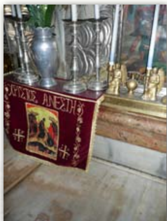
Miesto Ježišovo zmŕtvychvstania - Boží hrob.