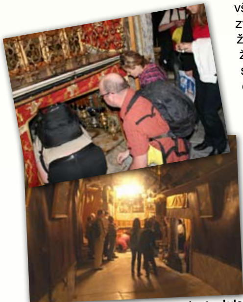
Jaskyňa narodenia Pána - miesto, kde sa Slovo viditeľne stalo telom.

Treba podotknúť, že nielen bazilika, ale aj celý Betlehem zaváňa neobyčajne obyčajnou zvláštnosťou. Priamo v Bazilike Narodenia Pána sa nachádza Jaskyňa Narodenia Pána. Je dlhá 12 metrov a široká i vysoká 3 metre. Celá je sťaby odetá do azbestového súkna. Tam si