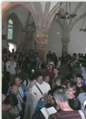
Miesto Poslednej večere

Pred vstupom do domu sa každý Žid musel očistiť. Umyť nohy bola úloha otroka. Pri Poslednej večeri to však robí Ježiš: zníži sa, aby ukázal, akou láskou máme i my milovať. Následne odovzdáva seba v Eucharistii, on, prítomný v kúsku chleba a vína. O tri dni je Večeradlo miestom veľkej radosti, miestom stretnutia so Zmŕtvychvstalým. A na päťdesiaty deň po zmŕtvychvstání tu zhromaždení dostávajú Ducha Svätého, ktorý ich posilňuje a dodáva odvahu byť svedkami až do končín sveta. Láska k blíznym, radosť zo vzkriesenia, prosba o Ducha Svätého, ako i sila čerpaná z prijímania Eucharistie, i to patrí k odkazom Večeradla.